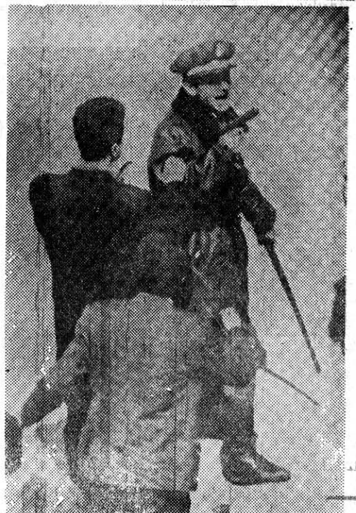
Yukarıdaki üç resimde son Amerikan deneyleri gösteriler görülmektedir en alttaki iki resim ise 28 Nisan 1969 olaylarından- dır. İTÜ Yurdu'nun basılışı olayı ister istemez o günleri hatırlatıyor insana.