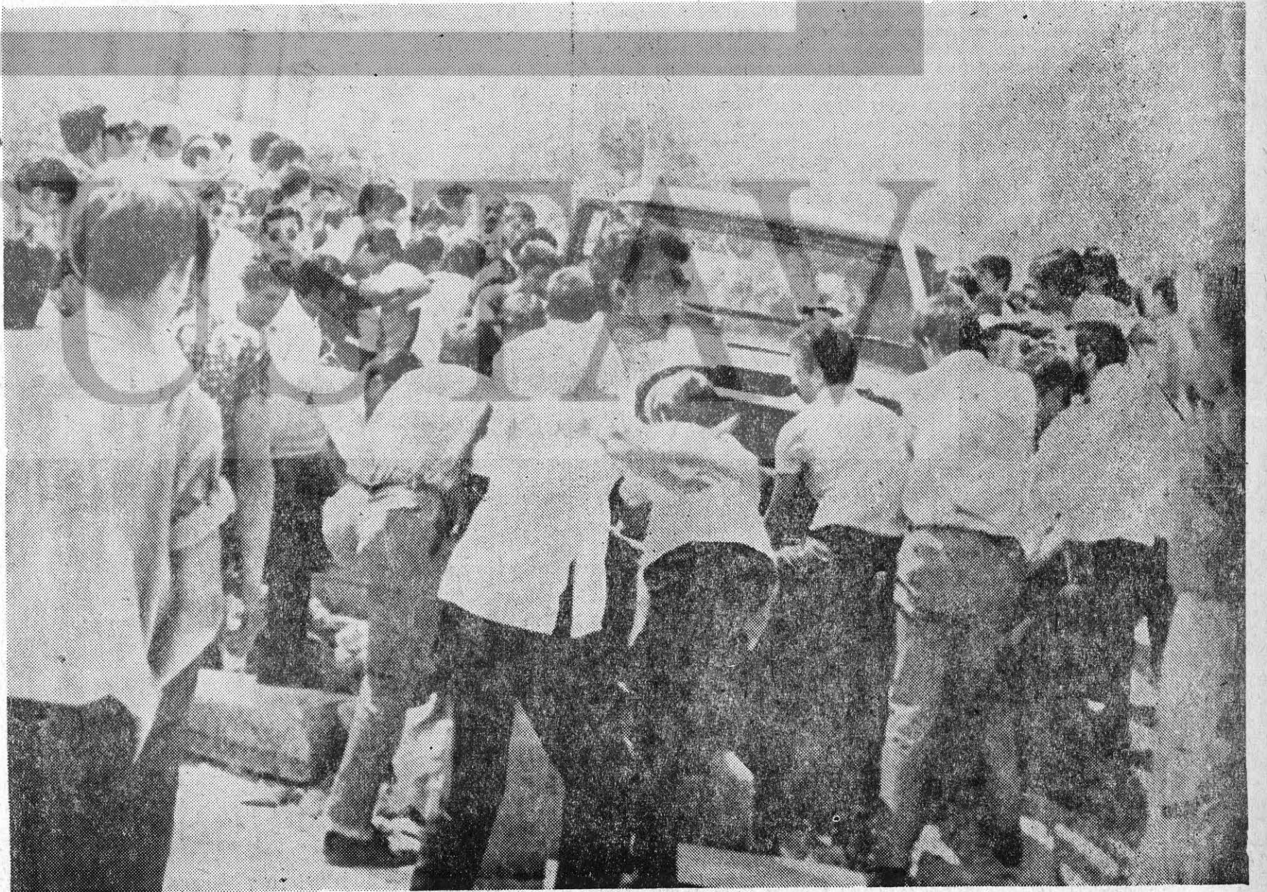
Çarşamba günkü olaylarda Gençler bir Amerikan arabasını denize atıyor.

Oysa yapılacak şey, emperyalistlerin vurucu gücü olan 6. Filoya halkın her yerde karşı çıkmasını sağlamak, pasif meydan mitingleri yerine yürüyüşler düzenlemek, halkın spontane hareketlerini organize etmek ve Amerika'ya gözlerle sözlerle değil, eylemle DEFOL demektir.